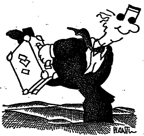
(Dessin de PLANTU.)

Avec un « trop tard » loconique, on les envoie se faire pendre ailleurs; bienheureux si, tout étonnés encore de leur audace, ils se trouvent nez à nez,